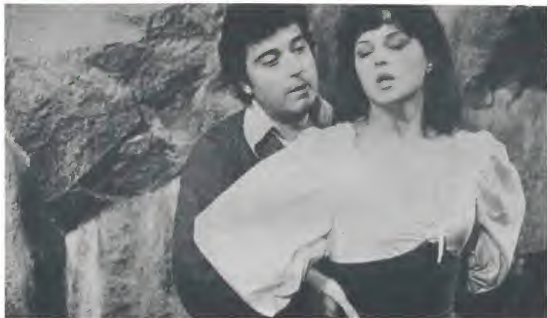
Andrés Pajares - Azucena Hernández